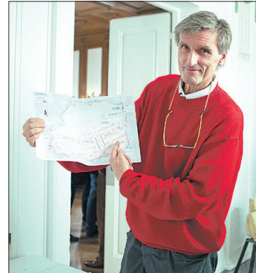
Veit glaubt, dass mehr Einheiten kommen. Viel Grün: So soll Steinhof neu aussehen!